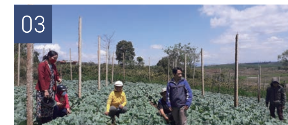
国際協働プロジェクト Global Partnership Project